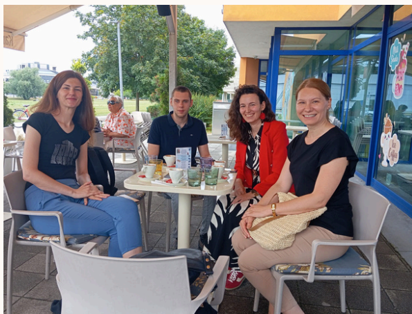
Karlovačka udruga spinalno ozlijeđenih - KaSPIN