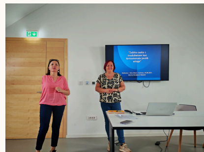
Savez udruga osoba s invaliditetom Karlovačke županije