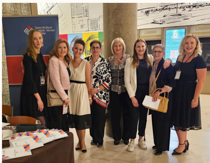
Savez društava multiple skleroze Hrvatske