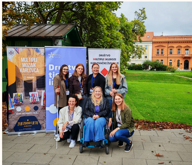
Društvo tjelesnih invalida