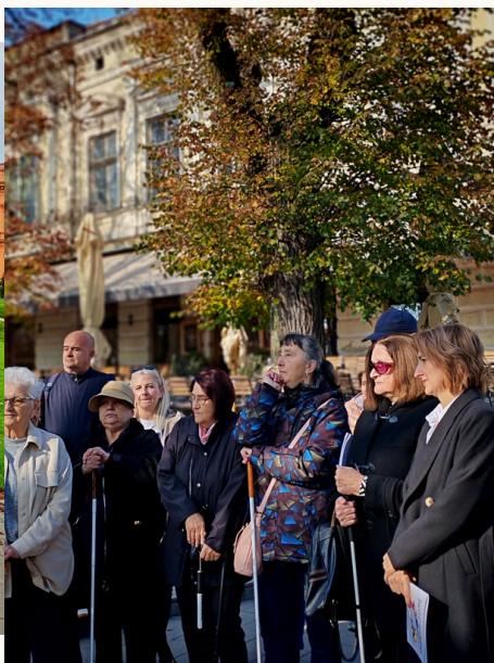
Udruga slijepih Karlovačke županije