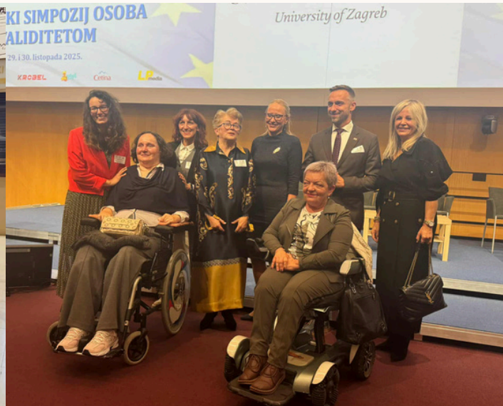
SOIH - Zajednica saveza osoba s invaliditetom Hrvatske