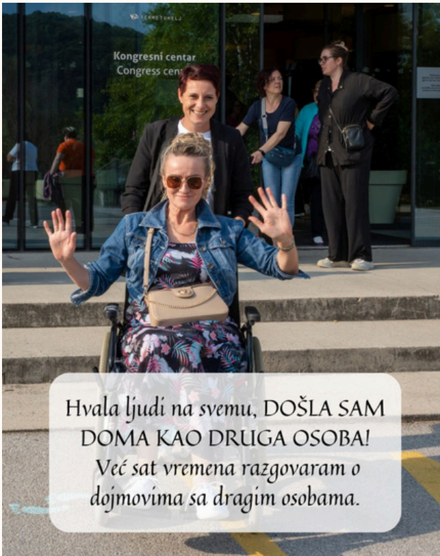
Hvala ljudi na svemu, DOŠLA SAM DOMA KAO DRUGA OSOBA! Već sat vremena razgovaram o dojmovima sa dragim osobama.