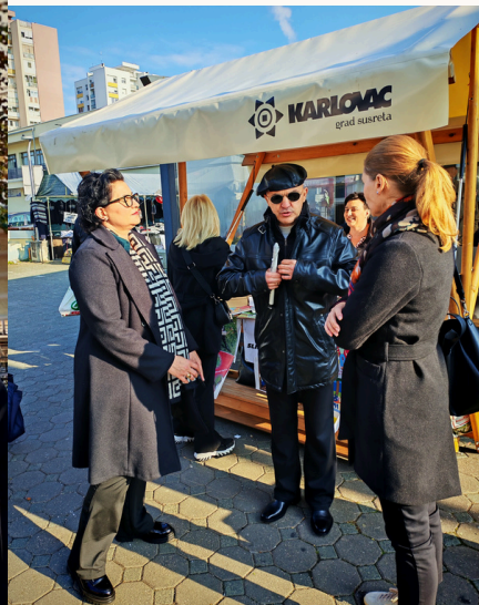
Udruga slijepih USKA